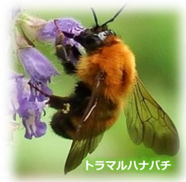
トラマルハナバチ