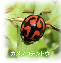
カメノコテントウ